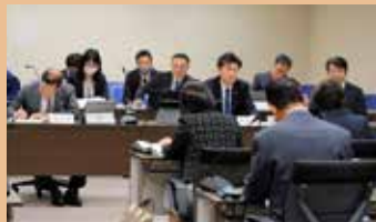
予算特別委員会の様子

予算特別委員会は、委員 12 名で構成され、令和 8 年度当初予算について審査しました。各委員の主な質疑項目を掲載します。