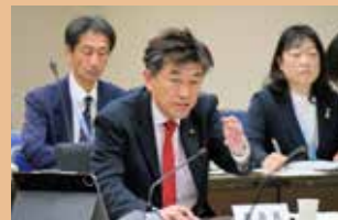
議事を進行する中座委員長