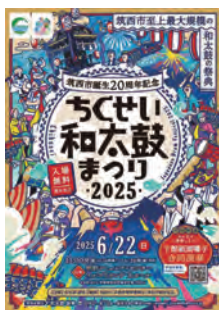
事業を活用したイベントの一例

的で、期間を区切って実施してきたが、当該補助金交付要件の一つとして、市民団体登録を「市民団体登録」しておいたこと、今後も継続的な活動に取り組んでいただくことを念頭に、また、具体的なおろーや支援としては、例えば、イベント開催や協力団体の募集に関する情報提供、筑西市民団体連絡協議会を通じたネットワーキングの推進、さらには筑西市民協働まちづくりサロンでの打合せスペースや備品の貸出しなどの支援が可能となっている。今後、それらに加えて、他の支援策についても検討してまいりたい。