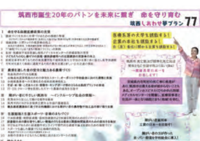
設案市長の公約「筑西しあわせ夢プラン 77」新年度予算にどのくらい反映されるのか？

【市長】西しあわせ夢プラン 77のうち、新年度予算に盛り込む項目はどの程度あるのか。 【市長】市長に就任したときに約6割の事業が既に何らかの形で進んでいた中で、新しい事業として、オーガニック推進事業、海外友好都市、子どもの権利条例などを予定している。 【議員】6割が既に事業化されていたとのことだが、残り4割のうち、どの程度新規事業として盛り込んでいくのか。 【市長】大体、1、2割ぐらいの予定である。