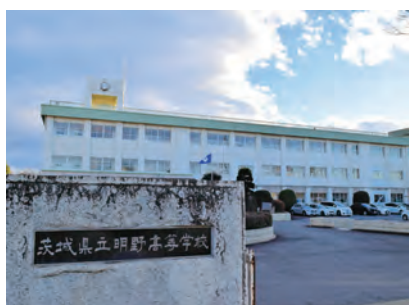
茨城県立明野高等学校

【市長】 まずは県と協議しながら、価格の課題等について、議員各位と相談の上検討を深め、方向性を決定したい。