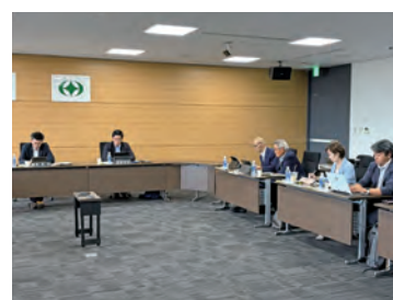
視察研修の様子（田村市）