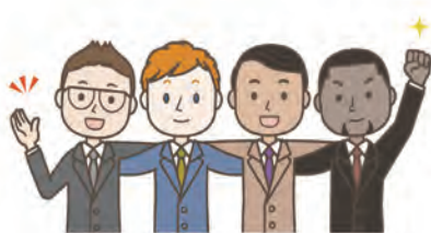
日本人も外国人もお互いが理解・納得できる行政運営の実現を！

【議員】外国人が農地の買い手となる場合、売り手に対するサポートは何か行っているか。 【農業委員会事務局長】買い手の国籍にかかわらず、農地法に基づく説明やトラブル防止の助言等を行っている。 【議員】農地のことだけでなく、行政全般において外国人政策を念頭に置く必要があると考えるが、市の考えは。 【市長】地域の方と外国籍の方が、お互いを理解し、安心して暮らせるよう取り組んでまいりたい。