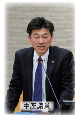
動画視聴はこちら

【議員】 若者が市政と関わっている取組は。 【市長公室長】 昨年は、県立下館第一高等学校の生徒の皆さんと「下館駅前」のスペースを活用したまちづくりをテーマに市政懇談会を実施した。 【議員】 持続可能な行政運営、若者が活躍できる地域づくりなど10年後、20年後を見据えた中長期の視点を立ち、政策的な部局横断的にまとめ、継続的に推進していく部署を設置してはどうか。 【市長】 現在、企画部がその役目を担っているが、部局横断的な部が今後必要になってくる。組織については研究を重ね、最終的な方向性が決ま