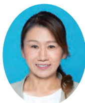
塚 田 砂 与 下中山497番地 (51歳)