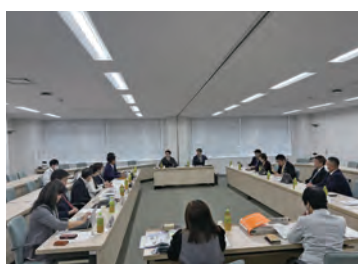
視察研修の様子(岩倉市)

①安城市議会では、市民にとって親しみやすく、市議会や市政について、より関心を持ってもらえる議会だよりを目指し、公職選挙法改正により18歳以上に選挙権が与えられたことをきっかけとして、市内高校生との共同による取組を実施している。具体的な取組としては、高校生が作成した作品を表紙デザインとして毎号掲載し、裏表紙には、議員と高校生の対談記事を掲載している。また、読みやすさについても工夫しており、従来、縦書き・2色刷りだったものを全面横書き・フルカラーに変更し、イラストやQRコードを使用するなど、より良い議会だよりの作成に向け、取り組んでいた。