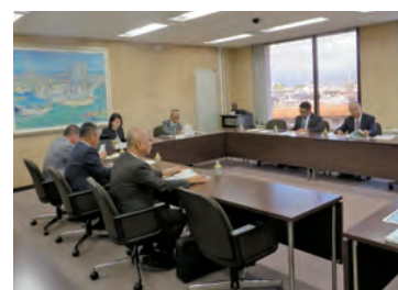
視察研修の様子(小田原市)