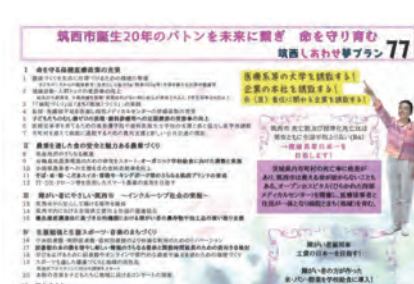
設案市長の公約「筑西しあわせ夢プラン 77」 新年度予算にどのくらい反映されるのか？

西しあわせ夢プラン 77」のうち、新年度予算に盛り込む項目はどの程度あるのか。 【市長】市長に就任したときに、約6割の事業が既に何らかの形で進んでいた中で、新しい事業として、オーガニック推進事業、海外友好都市、子どもの権利条例などを予定している。 【議員】6割が既に事業化されていたとのことだが、残り4割のうち、どの程度新規事業として盛り込んでいくのか。 【市長】大体、1、2割ぐらいの予定である。