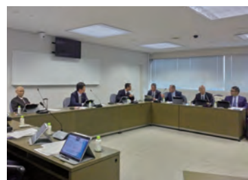
視察研修の様子（墨田区）