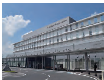
西部メディカルセンター

業務運営を監督すること。直接的な人事権は有しないが、中期目標の指示等により、適切なガバナンスを効かせ、可能と認識している。 【議員】「資金は出すが口は出せない」状況では。 【保健福祉部長】評価委員会等で課題解決に向けた関与や指導を行う機会はあると認識している。 【議員】西部医療機構の理事長と西部メディカルセンターの病院長の交代の予定は。 【市長】任期が今年度3月までであり、新年度に新理事長・病院長が決定の予定である。