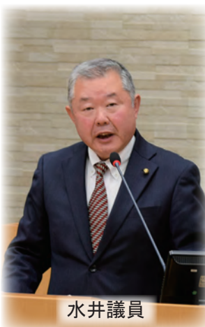
動画視聴はこちら

【議員】 本市の特定空き家以外の空き家の旧市町の区域別の件数及び総数は。 【市民環境部長】 特定空き家等に認定されている空き家は2件、特定空き家等以外の空き家と思われる家屋の件数は、令和7年3月末時点で、下館地区1,657件、関城地区382件、明野地区474件、協和地区380件、計2,893件である。 【議員】 空き家対策はどのような進めてきたのか。 【市民環境部長】 特定空き家や管理不全空家の増加を防ぐため、多角的な対策を進めてきた。具体的には、セミナーや情報提供による意識啓発、相談への助言、専門窓口への案内を通じ、所有者等に