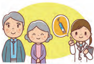
ワクチンで重症化予防

【保健福祉部長】新型コロナワクチン接種費用は国から 3 割程度交付税措置があり、残りの費用は自治体に委ねられている。助成額引上げは他の予防接種との兼ね合いから慎重な判断が必要である。 【議員】新型コロナワクチンの 7 千円を超える自己負担は、年金生活者にとっても大きく「打ちたくても打てない」という声が寄せられているが、市長の考えは。 【市長】財政状況を確認しながら検討を進めていきたい。 に對し、さらなる支援をするべきと考えるがどうか。