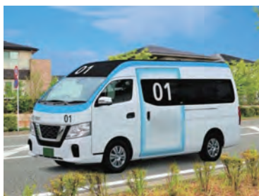
ワゴン車等による支線バスのイメージ

【市長】えは。車両や運転手、停留所の確保など、非常に困難ではあるが、高齢者が自立した生活を営むために、今後、検討していきたい。 【議員】各地域ごとの小さな支線バスでの細かな巡回により日常生活が完結できるよう、小さなコミュニティとコンパクトシティ実現の観点が必要ではないか。 【都市整備部長】現在利用されているのり愛くんや巡回バスの周知に努め、少しでも利用者を増やす方向で課題解決に向けて協議・検討していく。