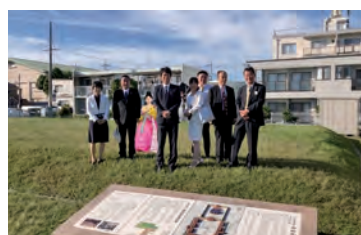
長岡宮跡にて（向日市）

テーマ ①復元・体感アプリ「AR長岡宮」によるまちづくりについて ②地域公共交通ネットワークの再構築について