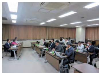
視察研修の様子(安城市)