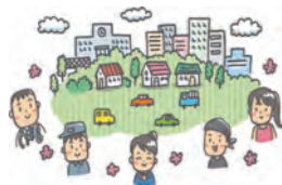
「筑西ファースト」に基づく市内産業振興の確保を！

【議員】 市内の建設業界では不平不満の声が上がっている。大手商社や市外業者がプロポーザル等で優先交渉権者となっていない状況について、筑西ファーストという観点に基づいた市長の考えは。また、県ではプロポーザルの審査に傍聴者を入れ公開しているようだが、参考にしてはどうか。 【市長】 事業所や企業、地域に暮らす全ての方々にファーストの気持ちを持ちながら進んでいきたいと考える。 【副市長】 参加事業者の考えも参酌する必要がある。既に、プロポーザル関係要綱の作成を指示している。