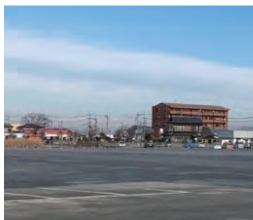
旧市民病院跡地の現況写真

【議員】旧市民病院跡地は、近隣に工業団地や商業施設、玉戸駅などがあり、さらには国道50号バイパス等が通っているなど市民生活にとって最適な地区と考えるが、この広大な土地を将来的にどのように利用するのか。 【市長】筑西市総合計画では、玉戸駅・玉戸工業団地周辺を産業拠点としての位置付けており、地域の発展に資する土地利用を図ることが重要と考える。旧市民病院跡地についても、地域の状況や将来のまちづくりの方向性を踏まえ、地域の活力向上に寄与できる様々な可能性について研究を進めていく。 【企画部長】当該区域は、その活用