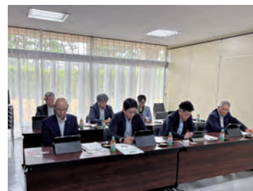
視察研修の様子（寒河江市）

②田村市では、移住人材確保事業として令和4年度からキッチンカー移住チャレンジを行っており、市が購入したキッチンカーを無償で貸し出し、開業、運営、移住等を手厚く支援するものである。事業の特色として、キッチンカーを起点とした市農作物をいかした食品の販売やブランドイメージの向上、農家と新たな事業の担い手とのマッチングにより生産から加工・販売まで行う6次産業化を推進し、新規就農者の獲得を目指している。本事業は令和7年度をもって終了予定だが、今後キッチンカーの貸与者に一定の条件を付けてキッチンカーを貸し続けていくこと等を検討している。