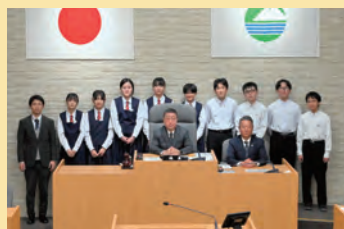
下館南中学校の生徒の皆さん