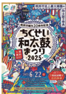
事業を活用したイベントの一例

的で、期間を区切って実施してきたが、当該補助金交付要件の一つとして、市民団体登録を「市民団体登録」しておいたこと、今後も継続的な活動に取り組んでいただくことを念頭に、また、具体的なフォローや支援としては、例えば、イベント開催や協力団体の募集に関する情報提供、筑西市民団体連絡協議会を通じたネットワーキングの推進、さらには筑西市民協働まちづくりサロンでの打合せスペースや備品の貸出しなどの支援が可能となっている。今後、それらに加えて、他の支援策についても検討してまいりたい。