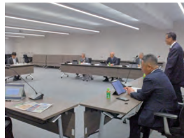
視察研修の様子（長野市）

②墨田区議会は令和元年から通年議会を導入した。定例会を通年とし、緊急時対応も可能とすることで、長の専決処分を削減し、突発事態への迅速な対応を実現。これにより執行部との連携が強化され、コロナ禍での「墨田区モデル」にも寄与した。一方、議論の少ない案件でも議会を開くため議員や執行部の負担が増大。効率化のための専決処分活用は実現せず、市民への周知不足や直接的な評価の乏しさも課題となっている。