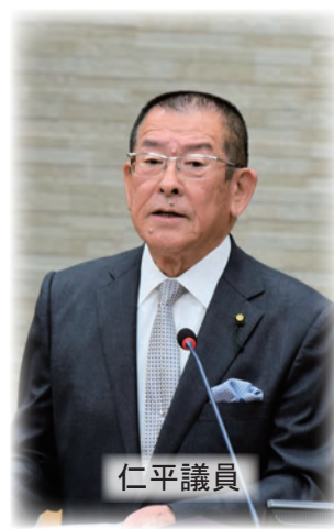
仁平議員 動画視聴はこちら