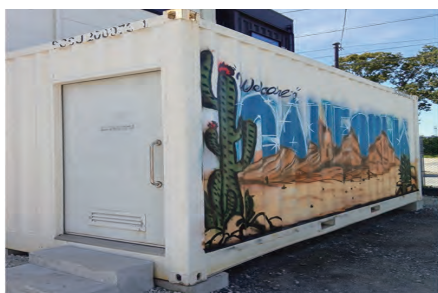
利用環境の向上を目的としたコンテナトイレの一例 用途に応じて洋式化やバリアフリー対応が可能

【都市整備部長】 令和7年7月に水戸線整備促進期成同盟会からJR東日本水戸支社に施設改善の要望書を提出した。既存トイレの改修は所管するJRが行うことが望ましいが、JR水戸線利用者以外にも近隣住民や筑西・下妻広域連携バスの利用者があるため、環境改善は必要である。と認識している。今後、引き続きJRに要望するとともに、議員から提案の手法も含め検討していく。