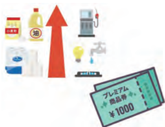
市民生活を下支えする物価高対策を！

法を検討し、できるだけ早く事業化を図り、市民生活を守る方法を検討していきたい。 【議員】新しい地方経済・生活環境創生交付金は、別々となっているが、デジタル実装型の活用状況は。 【企画部長】LINEを活用したデジタル窓口の実装、デジタル観光コンテンツの導入等に活用している。 【議員】地域防災緊急整備型についてはどうか。 【企画部長】本年度実施している避難所機能強化事業に活用している。