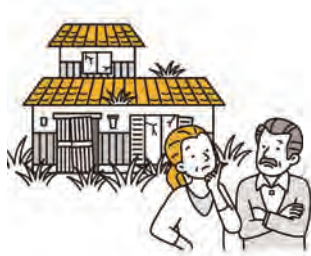
効果的な空き家対策の実施を！

【議員】 空き家対策に対する市の考えは。 【市長】 喫緊の課題と認識しているが、この解決には行政だけではなく、所有者、地域の理解が重要である。今後、空き家になる前の生前での意思の確認や空き家の所有者・相続人への相談会、有効活用への働きかけといった先進事例をしっかりと研究し、本市に合った対策を進めていく。