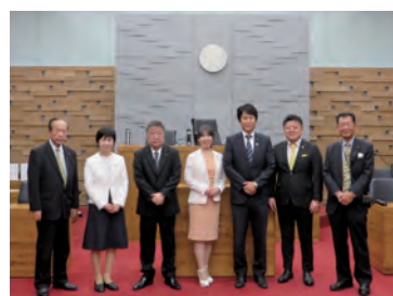
木津川市議会議場にて

①向日市は、市街地に史跡指定地が広く分布し、第1種低層住居専用地域に多く位置しているため、建物復元には一定の制限があり、さらに復元するためには数百億円単位の経費を要するものであった。そこで、拡張現実（AR）及び仮想空間（VR）技術等を活用し、史跡においてスマートフォンやタブレット端末をかざすことで、古代の都「長岡宮」が目の前にあるかのような体験ができるアプリケーション「AR長岡宮」を開発し、それを無料で配信することにより、史跡長岡宮跡への一層の理解醸成を図っていた。