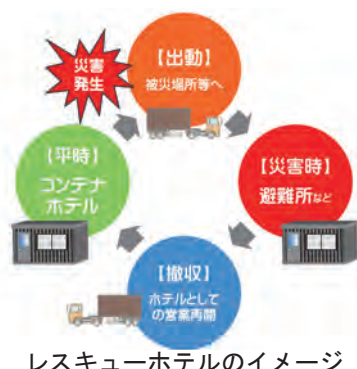
レスキューホテルのイメージ

の宿泊施設として使用することができ、まさにフェーズフリーに合致しているものと考えています。 【議員】今後、本市として優先的に進めていくフェーズフリー施策の方向性と導入時期は、 【市長】まずは「備えない防災」と言われるフェーズフリーという考え方の発信に努めていきたい。すでにホームページにも掲載し、広報紙にも掲載予定であることを「すぐにできることを家庭から」という形で市民へ広報してまいりたい。