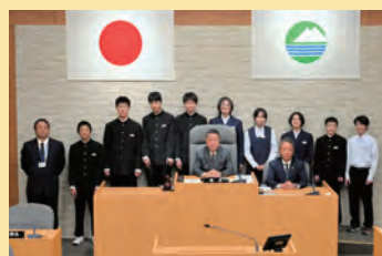
下館西中学校の生徒の皆さん

12月12日に「主権者教育」の一環として、市内の中学生60名の皆さんが本会議の傍聴と議場見学を行いました。