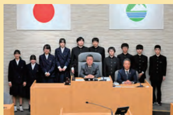
協和中学校の生徒の皆さん