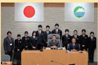
明野五葉学園の生徒の皆さん