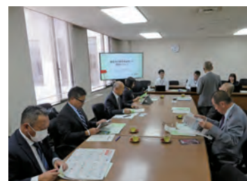
視察研修の様子(鎌倉市)

②小田原市では、昭和33年6月に小田原市立病院を開設。かつては医業収益がマイナスであったが、現在では全国の公立病院の中でもトップクラスの医業収益を計上している。収益向上における重点分野については、コンサルタントの意見を参考に事業管理者が決定し、その取組として「断らない救急」や「地域連携による紹介率・逆紹介率の向上」などを実践していた。また、医師確保・定着については、大学医局へのトップセールスや、紹介会社を利用し、病院長と事務局で認識を共有したうえで取り組んでいるとのことであった。