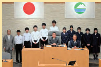
下館中学校の生徒の皆さん