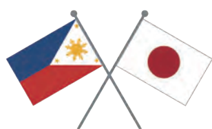
本市初となる海外友好都市締結に向けて着実な取組を！ (日本とフィリピンの国旗)

【市長】向けた交流がしたい」という趣旨の手紙を市長の友人を介して、その方の知人に託した。このことである。本市とフィリピンとの友好都市締結には、双方とも歴史があるが、双方とも歴史的つながりがあり、相当な時間を要している。セブ市がどのような市で、本市にどのようなメリットがあるのか、市民、議会に対し、きちんとした説明がない。これは市長のフライングではないか。 【市長】市長の仕事として、子供たちや経済交流も含めてメリットがあるもの判断し、進めていったものである。