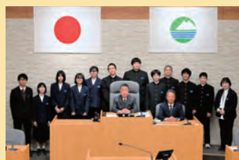
関城中学校の生徒の皆さん