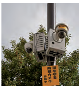
自治会設置防犯カメラ (写真はイメージ)

一方、県警発表によると今年上半期の住宅侵入窃盗件数が多いため、第1位が水戸市、第2位が本市となっている。防犯について、市全体として考える必要がある。小さい自治会でも設置できるよう、例えば、市が市全体の維持管理を地元業者に委託するなどの事例がある。ので、検討してはどうか。 【市民環境部長】維持管理を含めた市の防犯カメラの設置について、市防犯カメラ設置計画で令和5年度から令和9年度までの計画に進めている。市のカメラの管理等は職員がその都度対応しており、委託等の考えはない。