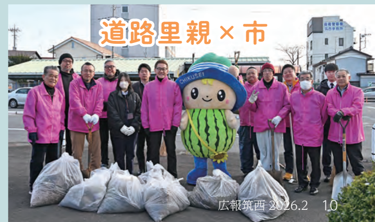
広報筑西 2026.2 10