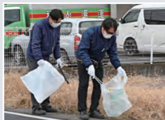
▶ 折本320番1地先～ 折本321番14地先 約240m (範囲 —)