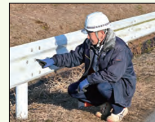
道路の施設などの 定期的な巡視