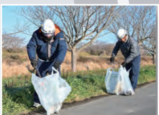
▶ 蒔田288番1地先～ 蒔田536番地先 約800m (範囲 —)