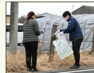
道路の清掃と除草