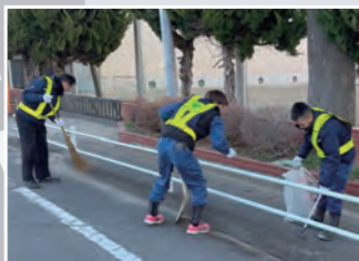
◀ 甲251番5地先～ 岡芹957番3地先 約710m (範囲 —)