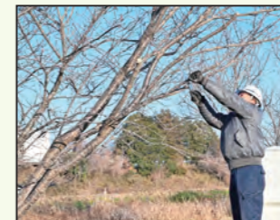
街路樹の軽易なせん定 と緑地帯の維持管理