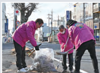
◀ 乙829番地先～ 二木成1370番地先 約500m (範囲 —)