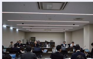
決算特別委員会の様子

決算特別委員会は、委員 12 名で構成され、委員が質した決算の質問は、約 200 項目。その中から、各委員の主な質疑項目を掲載します。