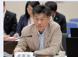
議事を進行する中座委員長