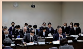
予算特別委員会の様子