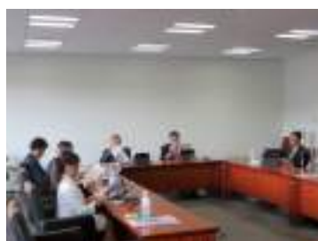
議会機能の強化へ（福島市）

米沢市議会では、平成25年度から「米沢市議会基本条例」に基づき「議会報告会・意見交換会」を開催している。平成29年度からは、これまでの内容を検証したうえで会場は1か所、議員は常任委員会ごとに班分けし、参加を希望する市民を対象にグループワーク形式で開催、意見交換会における市民からの意見・要望を委員会の政策提言として取りまとめ市当局へ提出している。