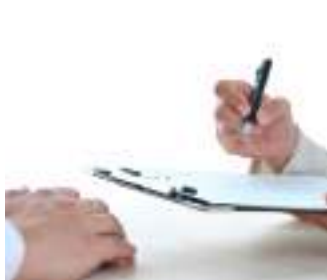
ハラスメントの実態把握を

【議員】に取組んでいく。相談窓口への相談件数実績は。 【総務部長】令和3年度は4件、令和4年度は3件、令和5年度は現在のところ3件である。 【議員】解決状況は。 【総務部長】本人がどうかという対策を希望する場合は個々によって異なる。職場を異動したい等の相談もあり、直接解決に結びつかないが、個別の相談受付を行っている。