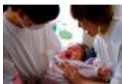
パパがする育児とっても大切

【議員】さらに父子手帳の交付により、積極的に育児をしている父親の割合が3年前より6%上昇した。また、マタニティコンサートの再開や筑西市子育て支援アプリ等SNSからの情報発信にも努めている。 【議員】最近の研究で男子学生や妊娠経験のない女性でも育児体験を積むことで子供を育てようとすると「親性脳」が発達し「親性脳教育」が大事である。発表された。本市が若い世代に注目されるためにも「親性脳」をキーワードにした子育て支援で全国的にアピールできないか。 【こども部長】情報を見ながら検討していく。