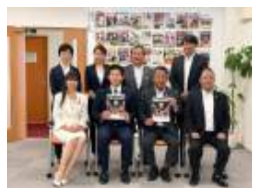
情報発信力向上に努める