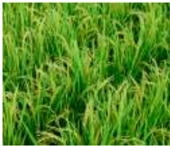
地域計画策定は膨大な作業量

業委員、農地利用最適化推進委員が地域計画を策定していくことになるが、その役割はますます重要なものになる。農地利用最適化推進委員の作業量の膨大さを見た報酬の引き上げはできないか。 【農業委員会事務局長】今後2年間で地域計画を策定しなければならぬことは、かなりの労力が必要だと考えている。報酬は、様々な報酬と等々現在この報酬となつていて、これを考慮し、今後様々な面