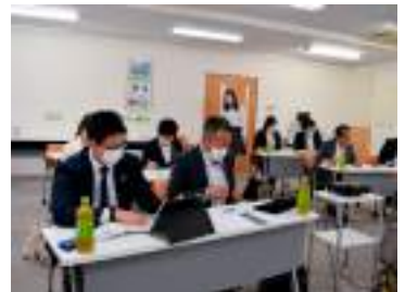
より伝わる議会だよりを目指して

編集及び発行にあたっては、常に市民・読者の目線を意識し、何を知らないのか、何を伝えるべきなのかを考え、手に取っていただける、わかりやすく見やすい、伝わる編集を心がけることが肝要である。議会が身近にあると感じていただけるよう、研修内容を活用し、今後も工夫・改善を図り、議会情報の発信力向上につなげていく。