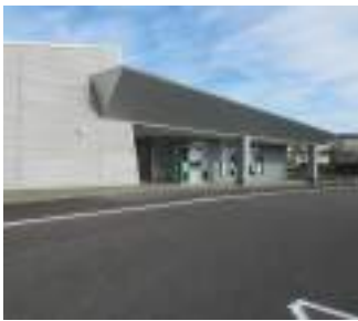
便利で思いやりのある行政サービス提供を！

要である。さらにスピード感を持って研究していく。 【議員】デジタル技術活用により総合窓口化できないか。 【総務部長】笠間市では、車内にシステム端末を搭載し職員が画面越しに対応する「動く市役所サービス」を導入する。先進事例を参考に、利点や問題点を調査研究していく。 【議員】運転免許証を返納された単身高齢者や身体障害者を対象に行政出張サービスを実施できないか。 【総務部長】境町、笠間市の動く市役所は検討の余地がある。調査研究し、前向きに考える。