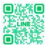
国土交通省道路緊急ダイヤル (# 9910) LINE 通報アプリ

【土木部長】年間約5億円。今後、維持費は増加していくと考えられる。 【議員】維持費を抑えることは可能か。 【土木部長】限られた予算の中で緊急性のあるものから順次整備していく。 【議員】道路維持に、道路里親制度やLINE通報システムなどを採用し、住民の手を借りる事は検討しているのか。 【土木部長】行政と地域の協働による道路のメンテナンスを視野に入れて周知を進めていく。