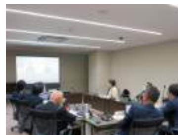
先進地の取組を視察

シティプロモーションの実施により、市内外の人に魅力を発信することで、認知拡大、意識変容、行動変容を促し、まちづくりの担い手を増やし、意欲を高めることで地域の持続的な発展という効果が期待できるということであった。