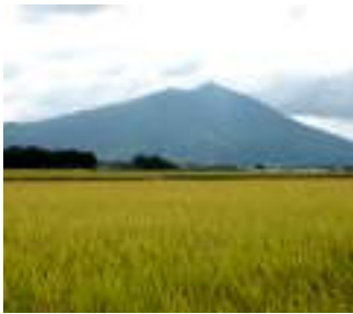
運営基盤強化に向けた合併を

【議員】土地改良区の運営において、今後、合併せざるを得ない状況になる。と考えるが現況は。 【経済部長】土地改良区の合併について、平成2年度から土地改良区の合併を推進し、現在では受益地300ヘクタール未満の土地改良区の解消を方針として進めてきた結果、平成2年度に存在していた32団体、の土地改良区が、令和4年度で177団体に減少した。今後も合併の推進により、受益面積の広域的な土地改良区を推進していく方針である。 【議員】下妻市、高道祖土地改良区、村外三ヶ村土地改良区、井出蛇沢堰