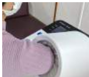
がん検診受診率アップへ

他の質問 男性用個室トイレへのサニタリーボックスの設置 安定したし尿収集運搬処理運営