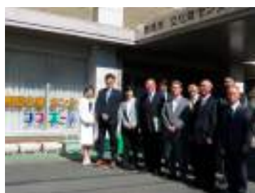
こども若者総合相談支援センター「ココエール」にて