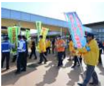
地域ぐるみで防犯意識の高揚を

市ホームページ・SNSへの掲載等による情報提供や相談窓口の紹介、筑西警察署や関係団体ご協力の下、出前講座やキャンペーン、イベント等での周知活動を行い、防犯意識の高揚を図っている。不審電話等への対策については、留守番電話設定の有効性について周知を行っている。 【議員】録音機能付電話機の購入費補助を行う市町村もある。本市の考えは。 【市長】市民の安心安全に向け、電話詐欺対策もいくつか考えていく。 【市民環境部長】他市町村を参考に調査研究を行う。