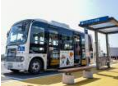
公共交通の地域格差解消へ！

【議員】路線バスが運行しない地域との格差をなくすことや、自宅からバス停や駅などの交通結節点までの移動手段の確保が必要である。いつでもどこでも予約・利用可能なAIオンデマンド交通システムの内容とは。 【土木部長】人工知能を活用することで、利用予約者に対して、最適な配車や運行経路の設定を行うシステムである。 【議員】されている。公共交通機関を利用し、体を動かす高齢者の健康増進につながるかと考えている。