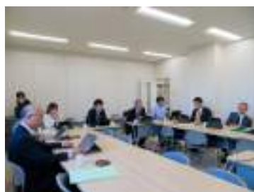
切れ目ない相談支援体制を視察