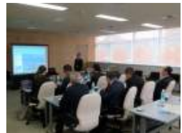
コンパクトシティについて学ぶ

射水市では、公共交通の現状と課題を整理し、今後の在り方や目標、まちづくり分野と連携した施策、役割分担等を示し、持続可能な公共交通の実現を目指し、「射水市地域公共交通網形成計画」を策定している。現在、AIオンデマンドバスの実証運行を行っており、高齢者や障害者、学生等の交通弱者の移動手段の確保とともに、効率的な配車等による輸送コストの削減やドライバー不足等にも対応した持続可能な公共交通の実現を目指している。