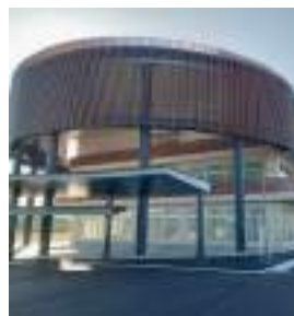
明野五葉学園周辺の整備を

【議員】計画はない。若い世代や子供が集まる絶好の機会である。この地域は人口増加の可能性が大いにあり、そのためには住宅地拡大に向けた道路や水道、排水などのインフラ整備が不足している。行政主導による整備はできないか。 【企画部長】今後の検討課題とする。 【議員】住宅地化に向け、都市計画で、新たな取組はできないか。 【土木部長】地区計画が考えられるが、今後の方向性を見極めながら検討する。