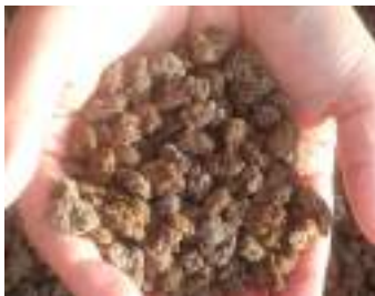
「ダテソイル」 下水汚泥から作られた「宝の肥料」 (筑西市下館水処理センターにて)

【保健福祉部長】現在のところ、県で下水サーベイランスに関する取組は検討されておらず、国や県の動向を注視し、定点観測による患者数報告を参考に、感染症対策を進める。 【市長】調査研究を第一歩として考えていく。 【議員】「ス」は、個人情報を得ることなく、地域における感染者の有無や感染状況の変化を正確に把握でき、情報インフラとして大変有用である。新型コロナウイルス（定点観察）へ移行し、正確な感染状況がわかり、導入できないか。 【保健福祉部長】