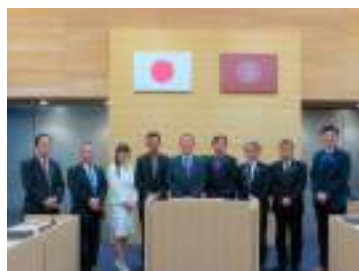
米沢市議会議場にて

テーマ ①議会報告会・意見交換会について ほか ②市長等への政策提言の取り組みについて ほか