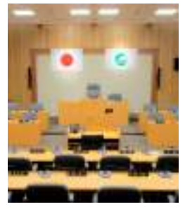
迅速な対応が可能となる

【市長】市、坂東市が導入して4月からの導入を予定し、専決処分の基準を緩和している。既に導入している市町村において、実際に年4回の定例会を開催するなど、議会運営上大きな変化はない場合が多い。一番重要な点は災害時における迅速な対応であり、メリット・デメリットともにあるが、通年議会制について研究を行っているかどうか。 【市長】長所・短所ともにあるものの、通年議会という制度があるのは事実。また、委員会の継続審査や臨時議会の開催による対応の方がよいという考え方もある。