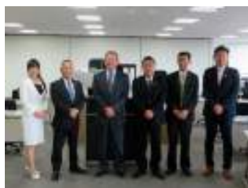
福島市議会議場にて