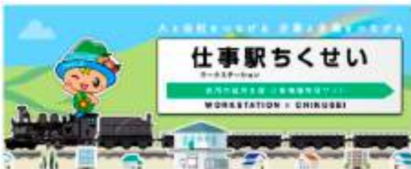
就労・創業支援により若者が活躍できる環境の整備を

がら、創業支援事業を推進している。具体的には、創業希望者を対象とした創業セミナーの開催、スピカビル1階にあるテナント「チャレンジショップ」で所得の向上を図り、また、市内空き店舗の活用を推進している。「チャレンジショップ」は、低額で貸付し、一定期間事業を営む店舗である。空き店舗等活用事業補助金は、新規出店者に対し、改装費、賃貸料を補助するものである。