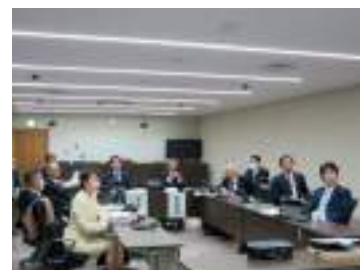
オンラインによる研修を開催