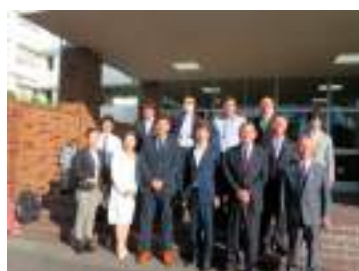
春日井市立岩成台中学校にて