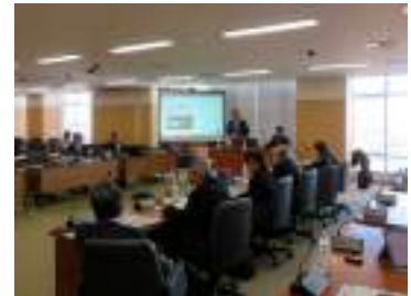
持続可能な公共交通に向けて