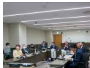
本市の担当課職員も出席