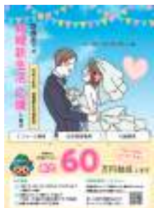
本市の取り組み「結婚新生活支援事業」

【議員】本市では現在、結婚新生活祝い金など、子育て世代への厚い支援を行っている。結婚新生活祝い金に29歳以下の場合、費用に最大39万円と年齢制限がある。移住婚やシニア婚による本市への転入増を目指す、市内の結婚した方々に対し、年齢制限のない「結婚祝い金」制度を新設できないか。 【こども部長】結婚新生活支援事業は、国で定められており、市が独自に年齢対象を拡大する場合、拡大部分を全額、市の一般財源による対応となる。対応した一般財源の中で対応しているところであり、ご理解をお願いします。