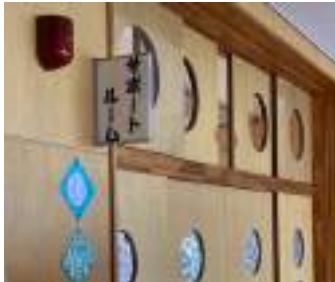
不登校児童生徒への支援は教育現場の大きなテーマ

【教育長】支援体制として、下館西中学校、下館明野中学校、校内教員支援センターを設置し、教室に行けない子供たちが学びたい時にいつでも、子供主体の学習を進めることができる。現在、他校においても同様のセンターを設置を進めている。 【議員】本市におけるフリースクールの種類は。 【教育長】教育委員会主管の教育支援センターが市内に4か所、民間フリースクールが1か所開設されている。令和6年4月1日に、民間施設がもう1か所開設予定である。