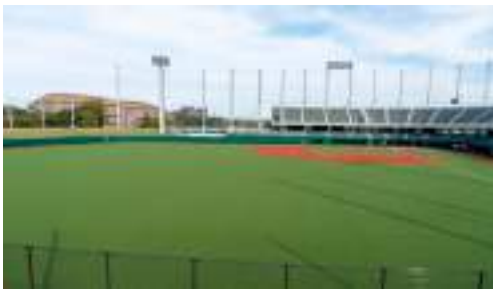
(イメージ) 多目的運動場による新しいまちづくりを！

【議員】定まった段階で、程度を定めていくものと認識している。 【議員】スタジアム構想によって、年間を通してイベント開催により、安定した交流人口も見込まれる。スタジアム構想をシティプロモーションの題材にしてはどうか。 【市長】指導者として、市全体をまとめ、関係部署と協力しながら考えていきたい。