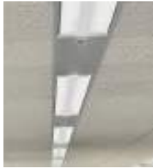
公共施設照明の LED化に向けて

答 LED照明器具の寿命が10年以上であること。また、想定している低減額で推移した場合、10年前後でリース料の損益分岐が見込めること、長期契約により料金の標準化が図られるためである。