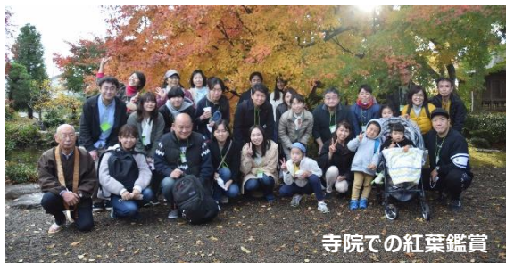
寺院での紅葉鑑賞

今回の募集では、私たちとともに、筑西市への移住を検討している方々を全力でサポートする「移住コンシェルジュ」を募集します。移住後の暮らしがイメージできるような情報発信や、オーダーメイド型移住体験ツアーによる市内案内、移住後の地域とのつながりづくりの支援等、筑西市で新たな生活をスタートさせる移住者のライフスタイルを豊かにするお手伝いをさせていただきます。