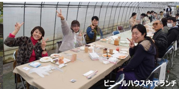
ビニールハウス内でランチ