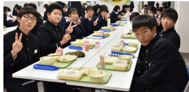
【問】 学校給食課 25-0131