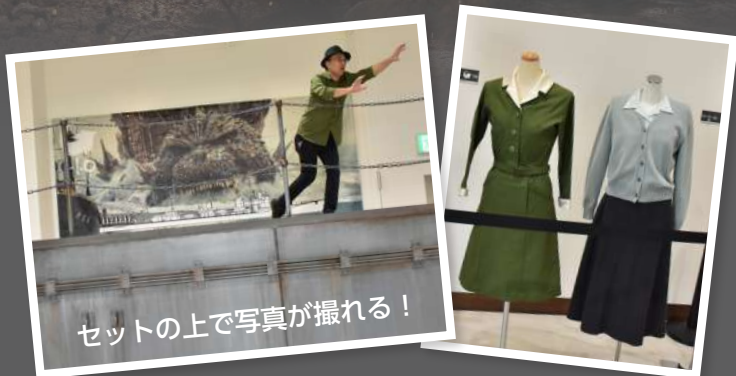
セット上で写真が撮れる！

劇中で撮影された駆逐艦「雪風」のセットやロケ風景写真などのパネル、衣装展示を行います。『ゴジラ-1.0』の世界をぜひ体感してください。