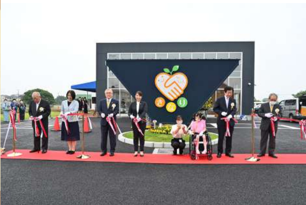
7月15日に行われた新施設オープニングセレモニー