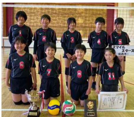
【混合の部】 優勝 スマイルスターズ