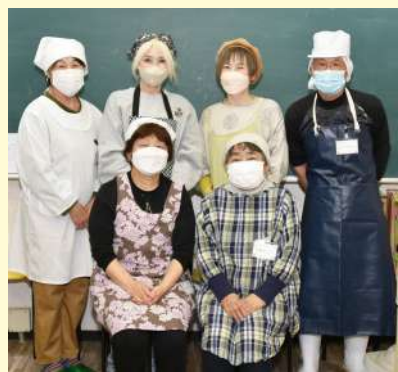
▲みんなの実家 モグモグキッチンのみなさん