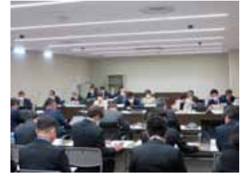
予算特別委員会の様子

3月10日、14日、15日の3日間、新年度の予算を審査する予算特別委員会が開かれ、令和5年度の一般会計、特別会計及び企業会計を審査し、いずれも可決されました。また、17日の本会議においても原案のとおり可決されました。選任された委員は次のとおりです。