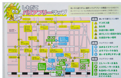
補助金を活用し作成したバリアフリーマップ