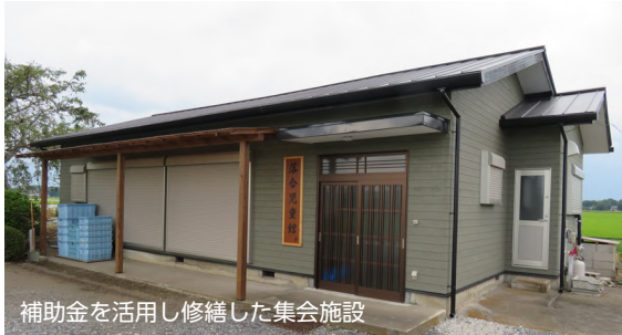
補助金を活用し修繕した集会施設