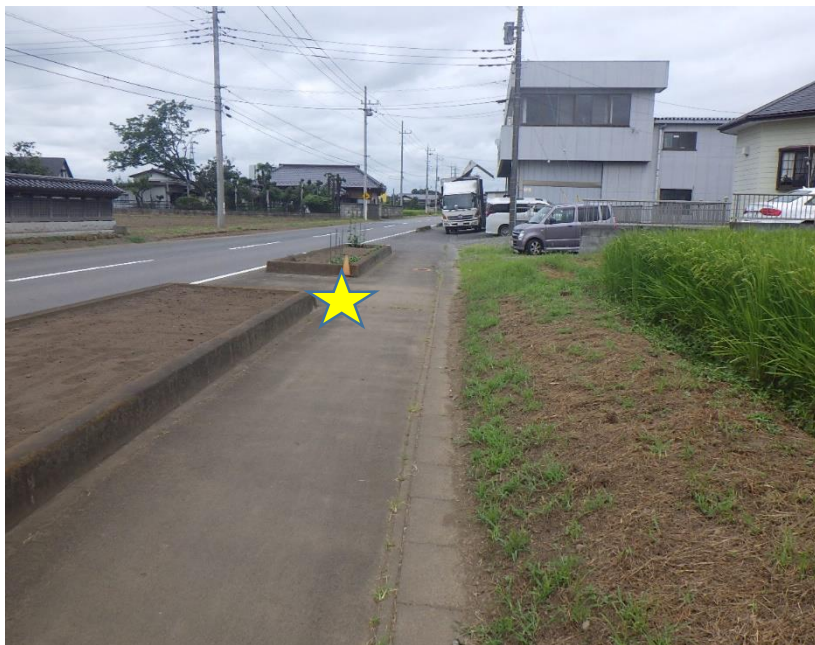
①田宿（藤沼製作所付近）