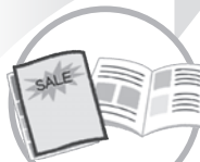
チラシ・カタログ