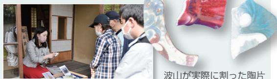
波山が実際に割った陶片