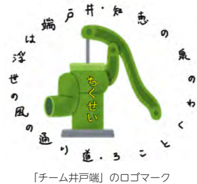
「チーム井戸端」のロゴマーク