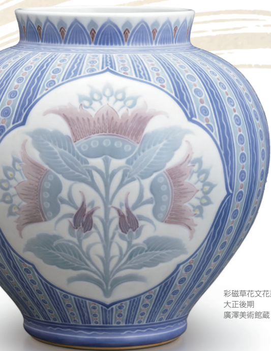
彩磁草花文花瓶 大正後期 廣澤美術館蔵

「生誕 150 年記念板谷波山の陶芸」の各種イベントが市内各地で行われています。