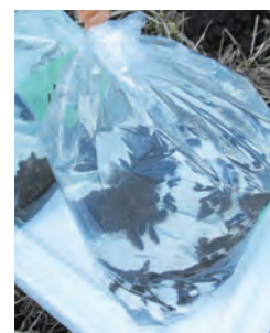
源氏蝿と平家蝿を交互に放虫

周辺の草刈りや、地域花壇の整備をしたり、子ども会で池の生態系観察会などを行ったりしています。令和3年2月には、第13回茨城県美しい水辺づくり優良活動として県農林水産部長賞を受賞しました。