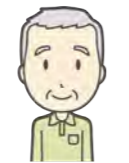
代表者が第1層協議体へ参加