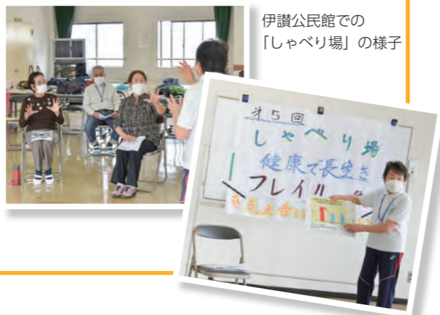
伊讃公民館での「しゃべり場」の様子

「笑みの会」で、コロナ禍で失われた地域のつながりを復活させたいという意見があり、同地区の「いきいきヘルス会」の協力を得て始まりました。参加者からは「地域の人と交流出来て楽しい」などの声が寄せられ喜ばれています。