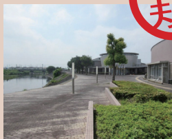
中央図書館東側スペース（屋外）