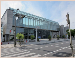
しもだて地域交流センター「アルテリオ」