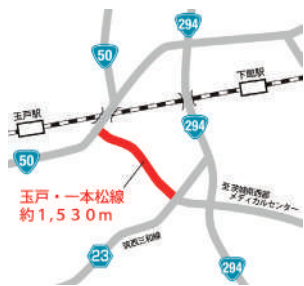
玉戸・一本松線 約1,530m