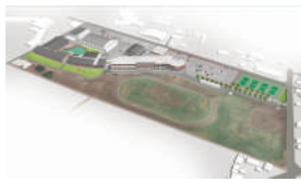
明野五葉学園完成予想図 (鳥瞰図)

人間関係を切らないような対応と教職員以外の相談できる場を提供し、いつでも相談できる環境を提供していく。また、オンライン授業を出席扱いにしていくほか、民間のフリースクールともさらに連携していく。