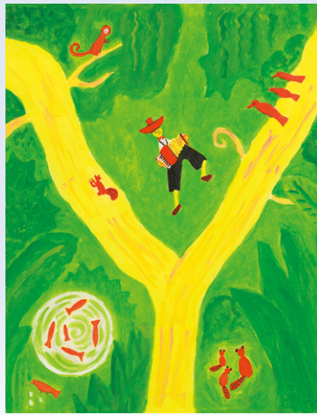
荒井良二『ユックリとジョジョニ』 (ほるぷ出版)より 1991年