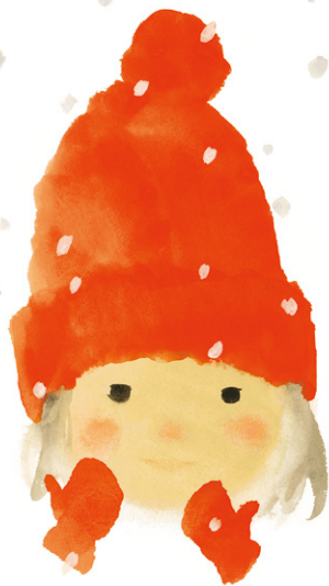
いわさきちひろ『ゆきのひのたんじょうび』 (至光社)より 1972年