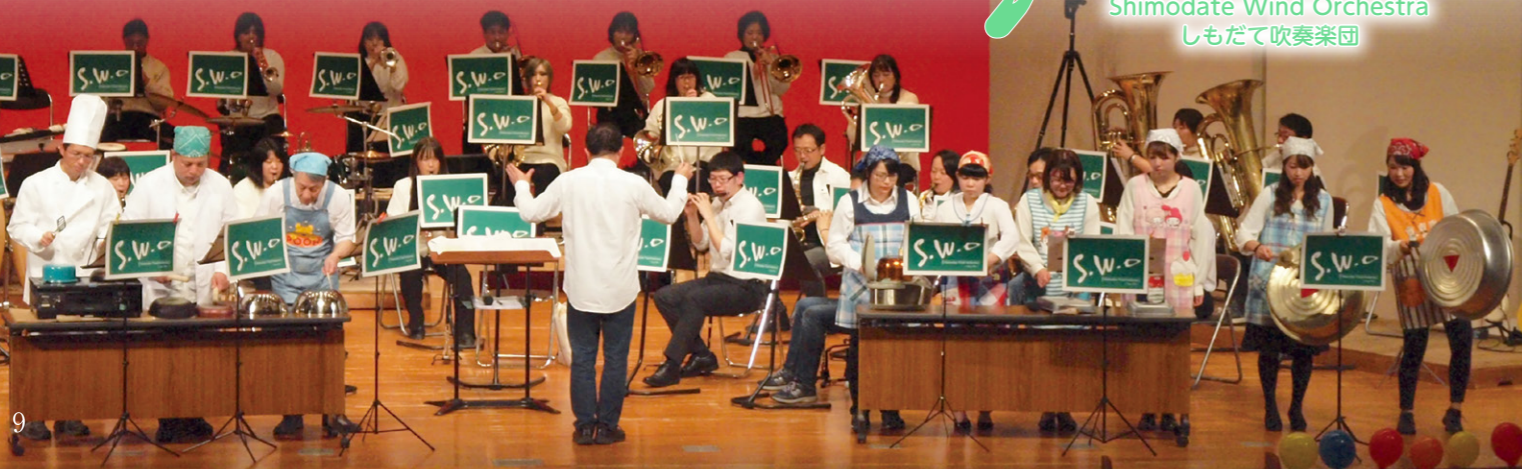
Shimodate Wind Orchestra しもだて吹奏楽団