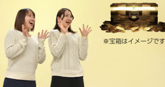
※宝箱はイメージです

集めた手がかりをもとに宝箱の在りかを特定しよう! 宝箱に書かれたキーワードは忘れずにメモしてね。