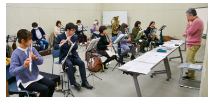
12月のコンサートに向けて練習する楽団員

団員は総勢28人で、保育園や小学校、福祉施設などへの訪問コンサート、また公共施設での自主コンサートなど1年間に十数回の公演を開催し、音楽の魅力を伝えています。しかし、新型コロナウイルスの感