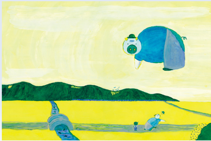
長新太『キャベツくん』(文研出版)より 1980年