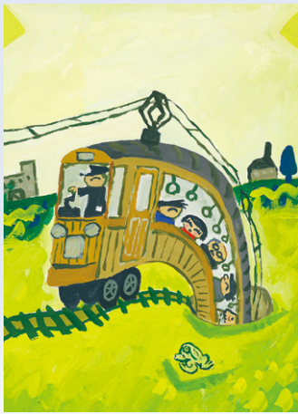
井上洋介『でんしゃえほん』 (ピリケン出版)より 2000年