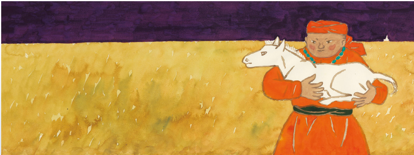
赤羽末吉『スーホの白い馬』(福音館書店)より 1967年