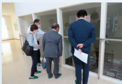
下館学校給食センター

市内主要施設の見学では、下館学校給食センター、茨城県西部メディカルセンター、農業資料館（久地楽）などを訪問しました。