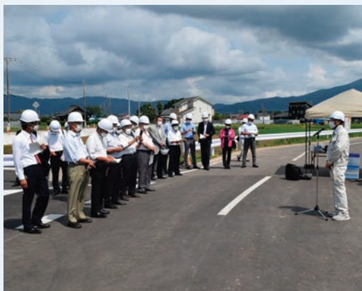
茨城県開発公社からの説明

市の役割は、用地の取得交渉事務や移転者支援、開発手続きに係る市内部調整を行っています。