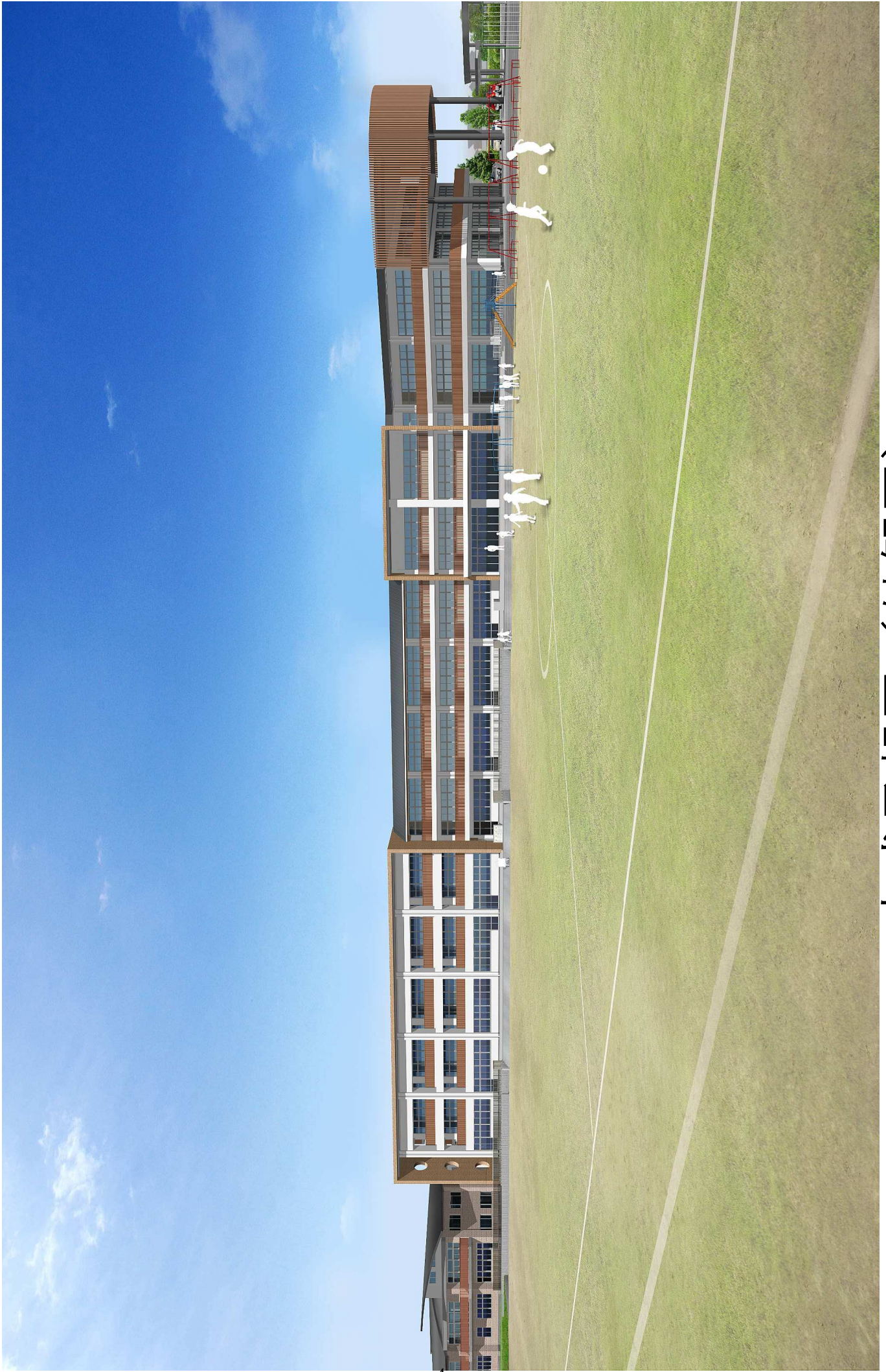
完成予想図（外觀図）