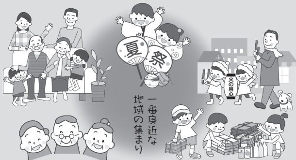
一番身近な地域の集まり