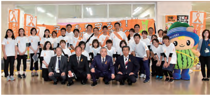
市役所を訪れたランナーのみなさん

11月1日、茨城県内で、子ども虐待防止の啓発活動を目的に「オレンジリボンたすきリレー」が開催されました。昨年から追加された県西コースでは、児童福祉施設や関係機関の職員などが県庁を目指して古河市役所を出発。中継地点となった筑西市役所では、訪れたランナーたちがオレンジリボンの配布やセレモニーを行い、子どもの虐待防止を呼びかけました。