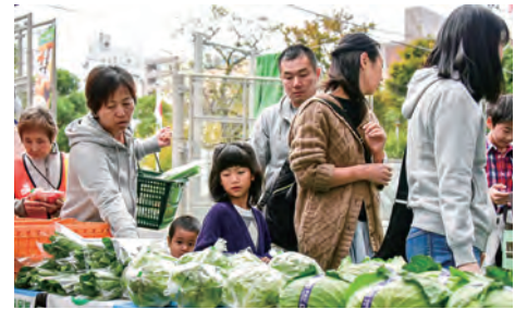
持参した農産物は盛況のうちに完売となりました

11月3日、台東区立蔵前小学校で行われた「蔵前小コミュニティ祭」で、市の特産物である梨や野菜などのPR販売を行いました。販売開始前から長蛇の列ができるほどにぎわいを見せ、購入した人からは「いつも楽しみにしている」、「筑西市の野菜やお米はすごくおいしい」といった声がかれました。