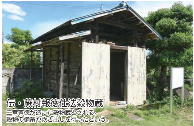
伝・蕨村報徳仕法穀物蔵 二宮尊徳が造った穀物蔵とされる。 穀物の備蓄や炊き出しを行ったという。