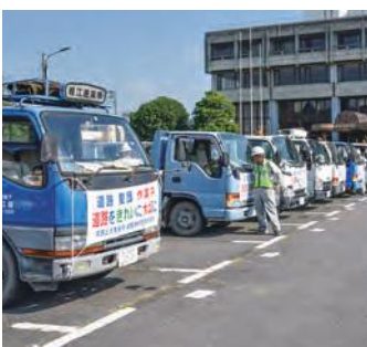
下館庁舎で出発を待つトラック

8月9日、市と筑西土木事務所、茨城県建設業協会筑西支部、建設ボランティア下館、関城建設業親和クラブ、明野建設業倶楽部、協和建設業倶楽部が共同で、市内の主要道路、市内の主要道路の美化清掃活動を行いました。この活動は、道路の意義、重要性に対する関心を高めるために制定された8月10日の「道の日」に合わせて毎年行われていきます。この日の参加者は217人で、道路などのごみを約1時間30分かけて回収し、可燃ごみ210袋、不燃ごみ106袋分を集めました。