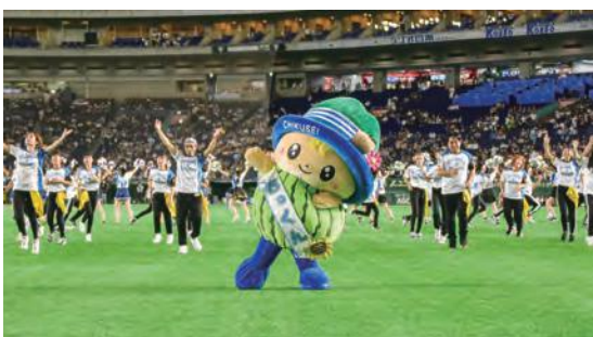
東京ドームでダンスを披露するちっくん

市内からの参加者16人を含む約240人の茨城県ダンサーと一緒に華麗なダンスを披露し、東京ドームに訪れた観客約3万人を盛り上げました。