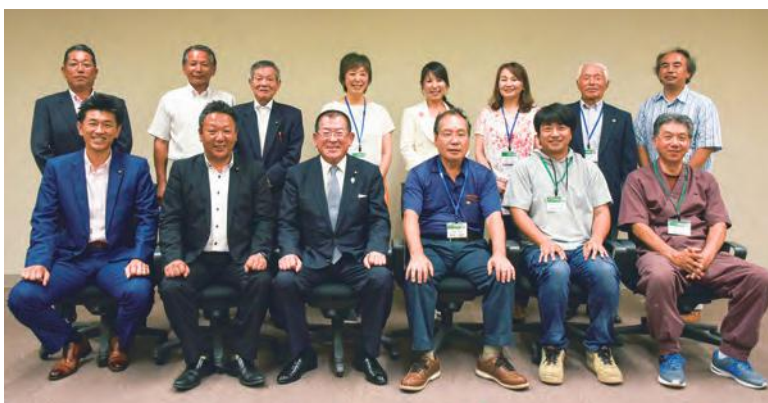
取材にご協力いただいた議会広報委員のみなさんを囲んで

参加した市民記者からも「市議会 議員の地元を愛する熱い想いに触れ ることができた」、「同じく広報紙づ くりに関わる者として、議員のみな さんに負けたくないように、市の魅力を 伝えて行きたい」などの意見があり、 大変貴重な機会となりました。