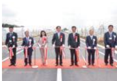
テープカットを行う来賓のみなさん