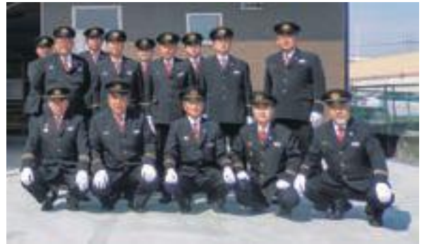
第3分団のみなさんと新たな拠点となる詰所