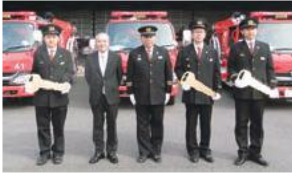
第24・35・41分団に最新のポンプ車が引き渡されました

式には、消防関係者や地元の人など約30人が参加し、新たな拠点の完成を喜ぶとともに、地域に根ざす消防団活動を誓いました。