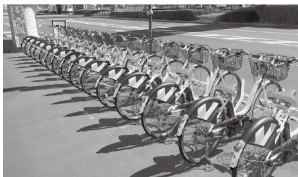
サイクルステーション 筑西市役所