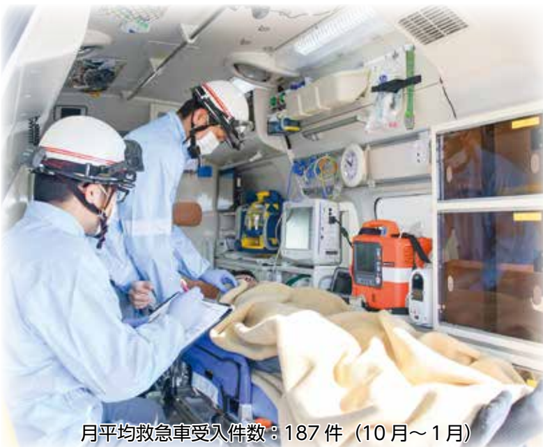
月平均救急車受入件数：187件（10月～1月）