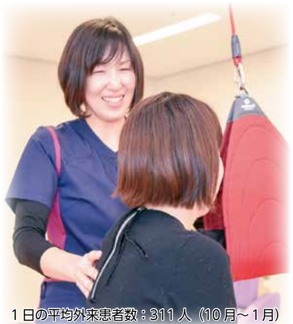
1日の平均外来患者数：311人（10月～1月）

受付時間は午前8時30分～11時までとなります。なお、診療科により、当日受診できない場合もあります。その際は、後日、予約で診察させていただきますが、初診料とは別に選定療養費（2,160円）を負担していただきます。