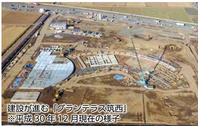
建設が進む「グランテラス筑西」 ※平成30年12月現在の様子

現在建設中の「道の駅」の名称を募集したところ、103件のご応募をいただきました。