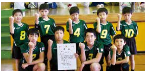
第3位 BONDS バレーボールスポーツ少年団