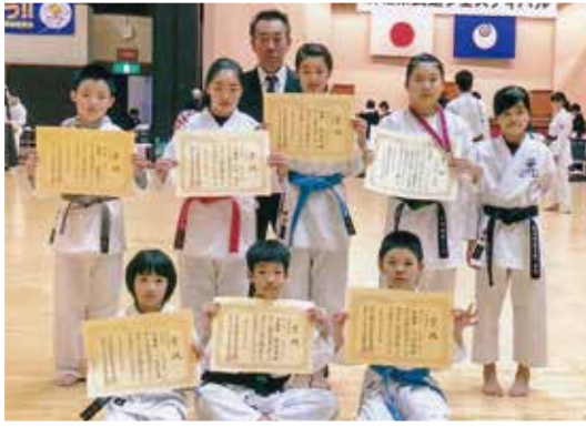
平成30年度 茨城県武道フェスティバル 空手道大会 11月23日 茨城県武道館