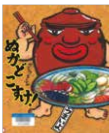
※出典「週刊新刊全点案内」より

初めての仕事で張りきる、入れものの“かめ”。でもおばあちゃんに入れられたのは、ぐちゃぐちゃしたものでがっかり。おまけに毎日かきまぜられて、においと笑い声が!中にいたのは…。ぬかづけのおいしい秘密がわかる絵本。