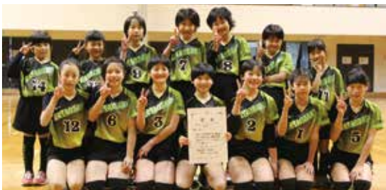
第3位 嘉田生崎バレーボールスポーツ少年団