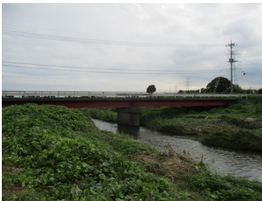
大谷川・筑瀬橋（下館地区）