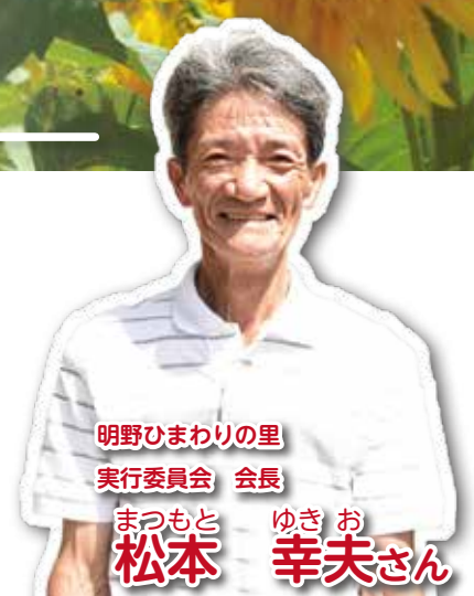
明野ひまわりの里 実行委員会 会長