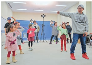
一般公募の市民のみなさん