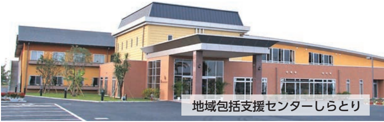
地域包括支援センターしらとり