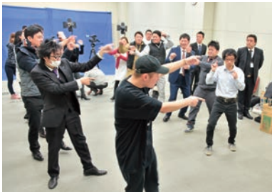
(公社) 下館青年会議所のみなさん