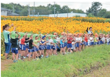
明野幼稚園年長の園児たち