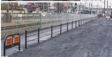
▲花の前歩行者専用道路