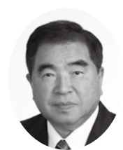
真次洋行 幸町三丁目8番17号 (67歳)