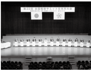
全国報徳サミット 日光市大会

【教育部長】社会科学の学習で、小さな努力をこつこつと積み重ねていけば大きな収穫や力に結びつくという、「積小為大」という教えを学んでいる。