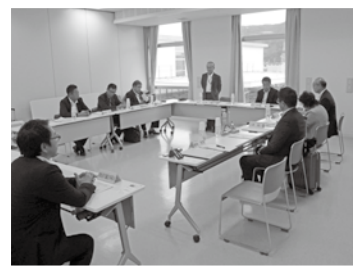
南魚沼市役所にて

南魚沼市では、県立病院等を含めた医療再編に伴い、既存のゆきぐに大和病院を縮小し、平成27年11月新たに南魚沼市民病院を140床で開院し、二つの市立病院で地域の医療を担っていた。南魚沼市民病院では、ゆきぐに大和病院で培った地域医療を押し進め、それまで地域が限定されていた訪問診療も南魚沼全域に展開した。両病院では電子カルテ等医療情報システムを共有し、医師、スタッフが相互連携をしながら医療に取り組んでいた。また、本年6月からは医師会設置の在宅医療推進センターを市民病院で受託し、地域全域の医療・介護機関、市民等からの在宅医療に関する相談を受けていた。