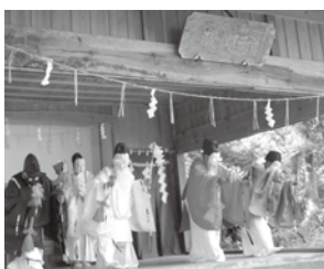
小栗内外大神宮太々神楽

【教育部長】神楽舞の保存継承や様々な所で披露公開もあり、他の団体とのバランス、財政的な面も含め様々な支援の拡充に努めてまいりたい。