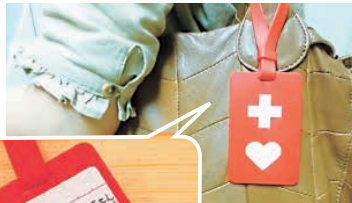
▲ヘルプマーク ▼ヘルプカード (展開図)

外見からは分からなくても、周囲からの配慮や援助が必要な人がいます。ヘルプマーク・ヘルプカードを付けることにより援助又は配慮を必要としていることを知らせることができま。