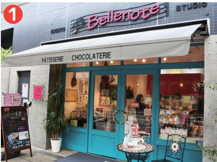
① 「スイーツスタジオベルノート」 東京都台東区浅草 3丁目 38-5 奥浅草で味わえるヨーロッパスイーツ