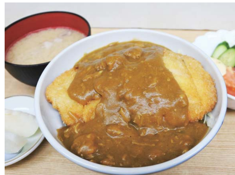
「河金 筑西 Ver」 「カツカレー」発祥の店である「河金」。歴史ある「河金井」が期間限定、筑西セットにて登場。 旨みたっぷりのキングポークの「河金井」に、美味しい筑西野菜のサラダ、味わい深いキングポーク豚汁、デザートには、果汁あふれる「梨」をどうぞ!!