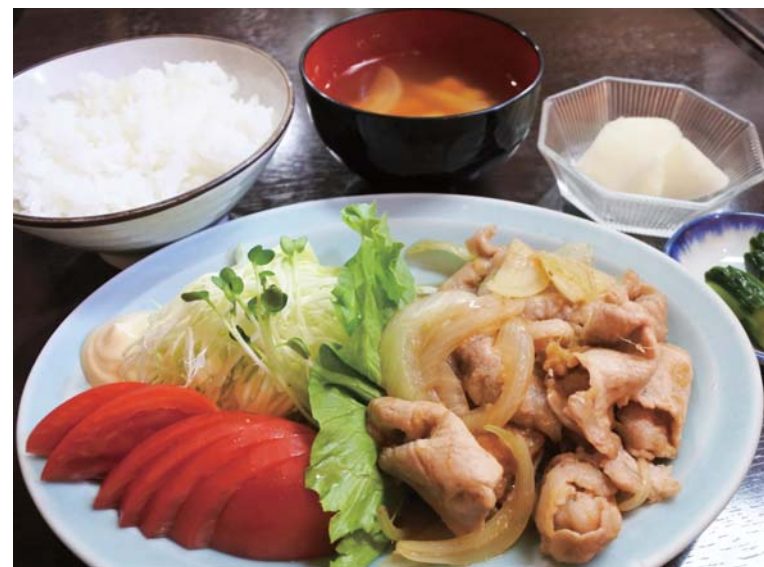
「生姜焼き定食 筑西 Ver.」 大門で人気 No1 の生姜焼き定食と茨城県「筑西市」とコラボレーション!! 上質で、脂身まで旨味のある「キングポーク」と筑西市の恵まれた大地で育った新鮮野菜を召しあがれ!!