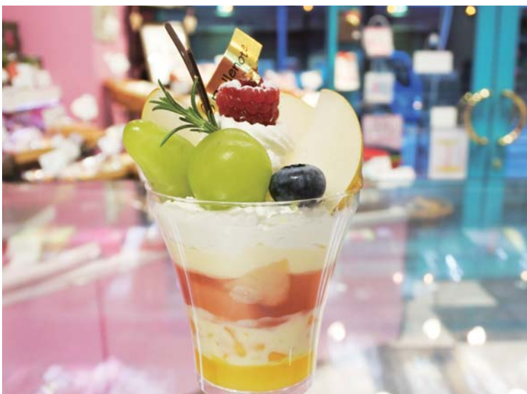
「秋の筑西パフェ」 贅沢にたっぷりと盛り付けた筑西名産の梨(豊水)と新米(コシヒカリ)のミルクリゾット&マンゴーで、秋の香り&美味がたっぷりのパフェに仕上げました。