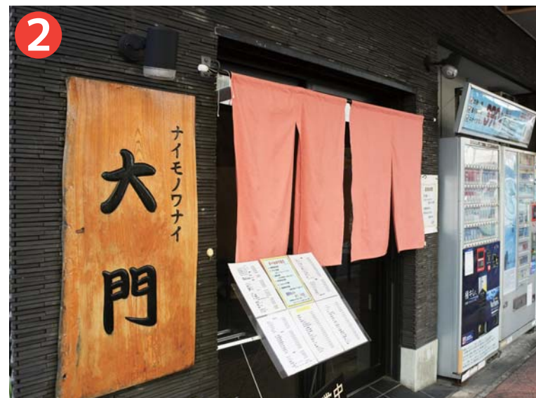
② 「大門」 東京都台東区浅草 5-17-10 バリエーション豊富なメニューとボリュームに定評