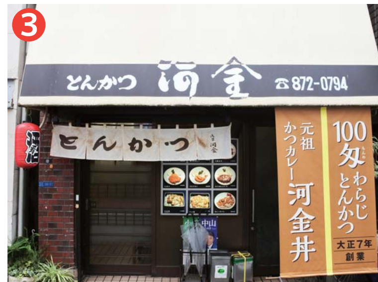
③ 「河金 千束店」 東京都台東区浅草 5丁目 16-11 間もなく100周年!! 大正7年から続く、「カツカレー発祥」のお店