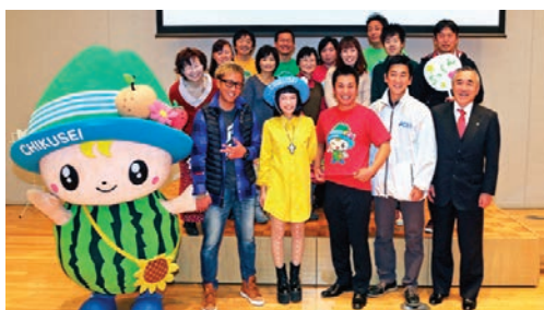
▲ちっくんのうた発表会 (平成25年11月)

こか懐かしい温かみのある歌詞になっていきます。「みんなのちっくん」は、筑西市のホームページで配信されています。