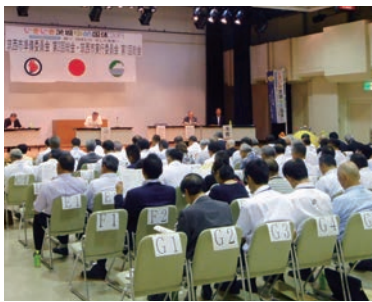
いきいき茨城ゆめ国体2019 実行委員会 羽ばたけ 羽ばたけ

7月19日、スピカ6階コミュニティプラザで「いきいき茨城ゆめ国体2019 翔べ 羽ばたけ そして未来へ」の筑西市実行委員会第1回総会が行われました。