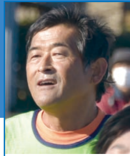
谷口浩美さん 1991年世界陸上選手権 男子マラソン金メダル