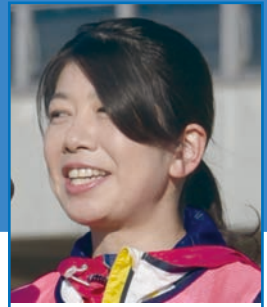
川崎真裕美さん 2009年アジア選手権女子 20km競歩金メダル