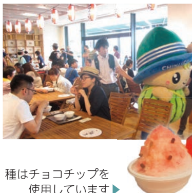
種はチョコチップを使用しています

あわせて開催されたかき氷グランプリには、地域活性化プロジェクト「ちゅくたくぐ」が考案した「黒こだますいかかき氷」を出品しました。惜しくも入賞は逃しましたが、かき氷を求め、たくさんの方が訪れ好評でした。