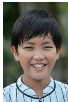
だいかい そら 大快 空

私の夢は、助産師になることです。一人ひとりの赤ちゃんの命を大切にしてお世話をあげたいです。