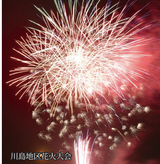
川島地区花火大会

8月5日に「第13回小貝川花火大会」、6日に「第42回川島地区花火大会」が開催され、筑西の夜空を照らししました。