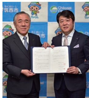
▲ケーブルテレビ高田代表取締役(右)と須藤市長(左)

用いた高速データ通信)を活用し、Wi-Fiスポットサービスの提供やライブカメラによる地域の防災・交通・観光情報の発信、コミュニケーションチャンネルによる地域イベントなどの生中継などを行います。