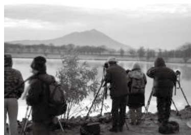
写真愛好家たちが集まる母子島遊水地

▼経済部 農産物ブランド化推進事業の戦略 観光資源開発事業及び観光客誘致拡大事業