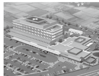
新中核病院完成予想図