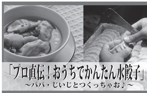
「プロ直伝!おうちでかんたん水餃子」 ～パパ・じいじとつくっちゃおう～