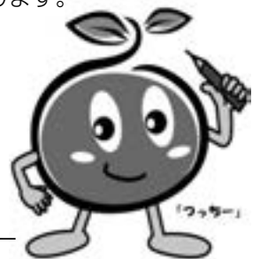
農林業センサスマスコットキャラクター

調査票に記入された事項については、統計以外の目的には使用されませんので、ご協力をお願いします。