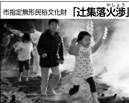
市指定無形民俗文化財「辻集落火渉」が行われます。

「辻集落火渉」は、辻の稻荷神社に伝わる神事で、参拝者が焼けた薪の上を素足で火渉りし、穢れを祓い、無病息災を祈ります。