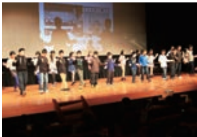
▲村田小学校の発表