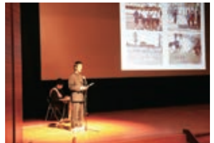
▲下館中学校の発表