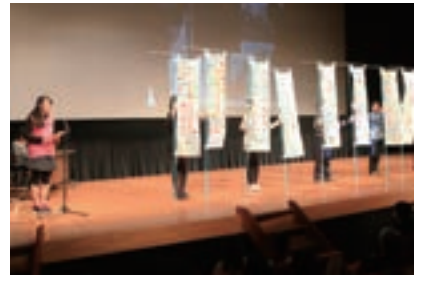
▲関城東小学校の発表