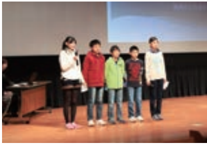
▲竹島小学校の発表