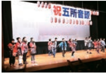
▲五所小学校の発表