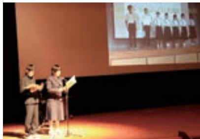
▲下館北中学校の発表