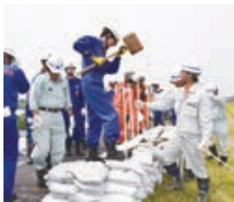
▲土のうを積み越水を防ぐ「積み土のう工法」

訓練には市内の消防団員の他、県筑西土木事務所、国交省関東地方整備局下館河川事務所の職員など約500人が参加しました。