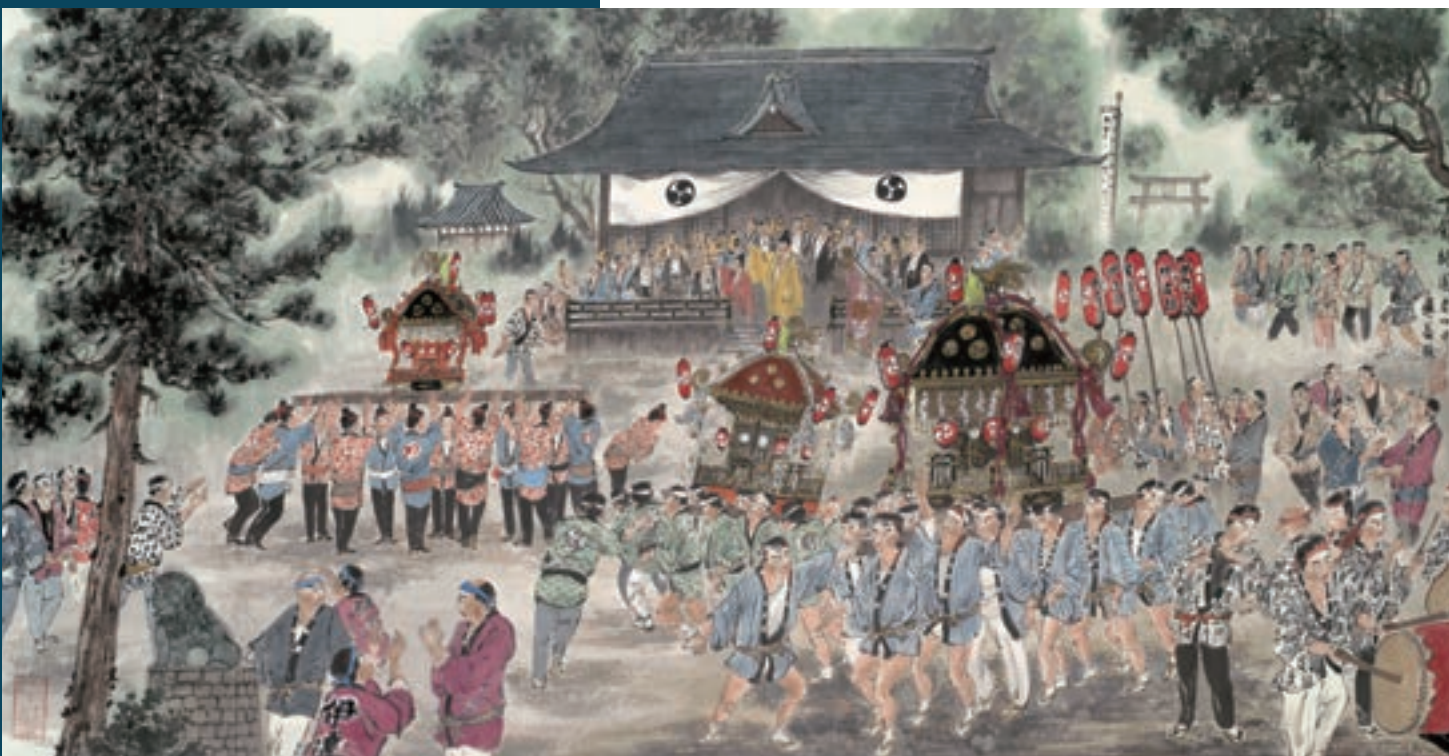
「下館祇園まつり」© Fu Yiyao

今展では、筑西市の魅力を伝える「下館祇園まつり」を題材にした新作を含め、50点の墨彩画を紹介します。