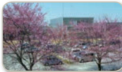
桜が咲き誇る駐車場

み無料駐車場が配置されています。年間20万人の利用者は、人工温泉・温水プール・トレーニンングジムや、大広間で食事やカラオケ、プロの歌手がボランティアで出演している歌謡ショーなどを楽しんでいきます。