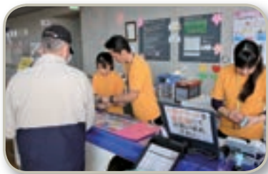
親切・丁寧な受付の様子

「水の特性を利用した多くの用途のプールがあり気軽に楽しめます。顔を水につけず動きのできるウォーキングやエクササイズは高齢者の