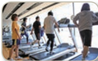
トレーニンングルームの様子

みなさんに人気です。スタッフが体力測定やその方に合ったトレーニンングメニューを作成指導しております。ぜひ体験してみてください」と、プール及びトレーナーズスタッフ。