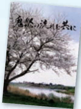
▲発足12年記念誌 「鬼怒の流れと共に」

中澤会長は「きれいな鬼怒川を取り戻すために今後も活動を続け、鬼怒川を愛する気持ちをみなさんに持ってほしい」と話してくれました。