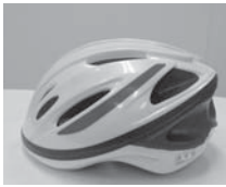
通学用ヘルメット

【教育長】ヘルメットの導入は、ある保護者の声と筑西警察署からの要望がきっかけとなり、中学生による交流集会（虹色ネットワーク）で、導入の是非を子供たち自身が話し合った。また、青少年育成市民の会など17団体からの着用要望やPTA連絡協議会からの購入時の補助要望等もありヘルメットの導入を決めた。購入時は2千円の助成を考えている。