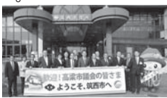
高梁市議会親善訪問来市 (11.1 ~ 10.25)

【企画部長】 高梁市での取り組みは、市内への移住者に対する住宅のあっせんや取得に対する助成が多く見られ、人口増加に直接結びつく施策である。教育的視点では、私立学校入学奨励金制度があり、市内に定住する学生の入学金を助成している。本市では、若者の新たな雇用を確保する企業誘致の促進や新中核病院の整備等により、安定し、安心して暮らし続けられるための生活基盤の整備等により定住促進を目指している。今後も高梁市の取り組みを参考に研究を進めてまいりたい。