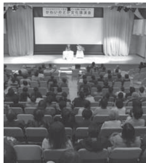
スピカ6F コミュニティプラザ 文化講演会

【増測議員】関係条例の改正を含め、もっと市民が利用しやすいような努力していただきたい。 【市長】市民にとって使い勝手が良くなる方法を考えていきたい。