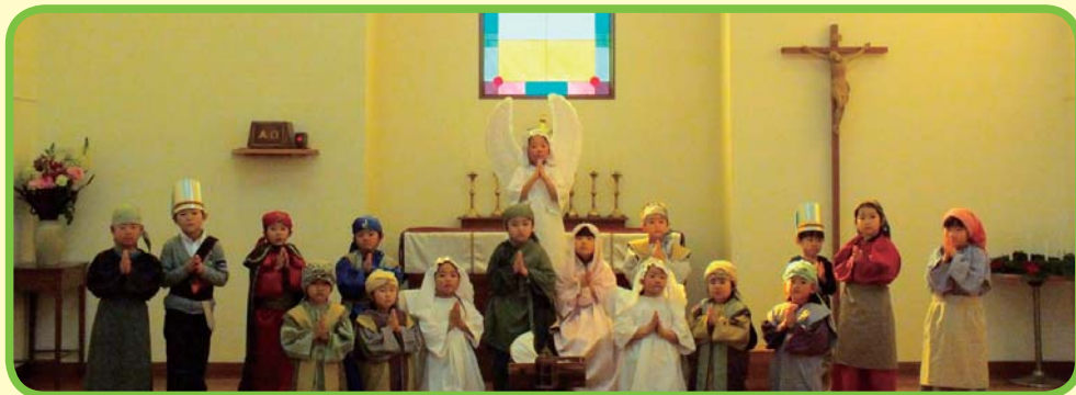
下館幼稚園クリスマス聖劇