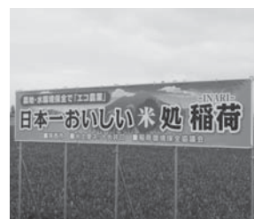
“日本一おいしい米”看板

【経済部長】日本一の米については、今年度、東京都台東区のコミュニティ祭り等でも新米を販売している。来年度からは、銀座にある茨城マルシェの展示場においても販売、PR等を行つてまいりたい。