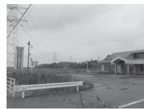
閉鎖後のせきじょう味覚センター

【経済部長】農協で6次産業の基地として利用したい話は、聞いていない。今後そのような話が農協から上がった場合検討したい。また西側の土地についてもその時に検討してまいりたい。