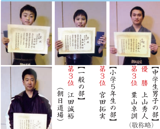
第33回八千代町近隣剣道大会 3月11日 八千代町総合体育館