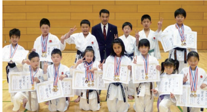
第38回茨城県少年空手道選手権大会 5月20日 常陸大宮市総合体育館