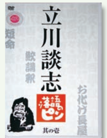
【ポニーキャニオン】

1993年の約半年間のみ、フジテレビ深夜に放送された落語番組「落語のピン」。其の壱は1993年4月放送の「鮫講釈」「お化け長屋」「短命」の3演目を収録。