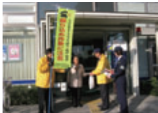
振り込め詐欺防止キャンペーン

※一呼吸おき、本当にありうる話かどうか冷静に考えてみましょう。家族にしか分からないことを質問するのが効果的です。