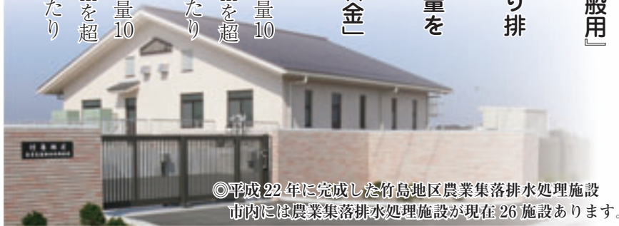
◎平成22年に完成した竹島地区農業集落排水処理施設 市内には農業集落排水処理施設が現在26施設あります。