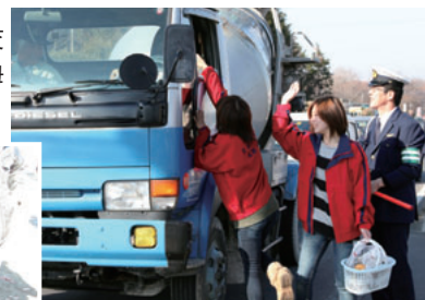
▲ドライバーに「安全運転をお願いします」と呼びかける交通安全母の会明野支部のみなさん