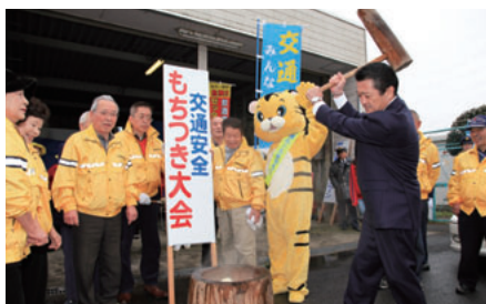
▲交通安全新鮮な気持ち（餅）をと、餅をつき、ドライバーに配り安全運転を呼びかけました。（筑西警察署で）

年末の交通事故防止県民運動の一環として、市内各地で「交通安全街頭キャンペーン」が実施されました。