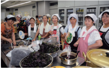
▶しそジュースを作る明野支部のみなさん

「しそジュース」は、さっぱりさわやかで、夏バテ気味の時は特におすすめだそうです。