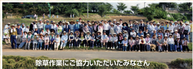
除草作業にご協力いただいたみなさん