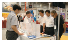
▲じっくり視察するメンバー ▼売り出し方も重要です。

特産品部会 現在、食材と格闘しながら試作品製作・試食・品評を重ねています。 10月23日の「やっぺえ」で試作品試食会を行いますので、楽しみにしてください！