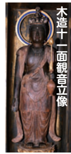
木造十一面観音立像

木造聖観音立像は、鎌倉時代後半の制作で像高71.5センチメートル、ヒノキ材、寄木造の市内でも数少ない鎌倉い仏として貴重です。